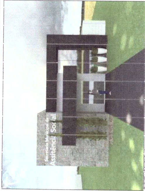
PROPOSTA DE FACIADA - V.01