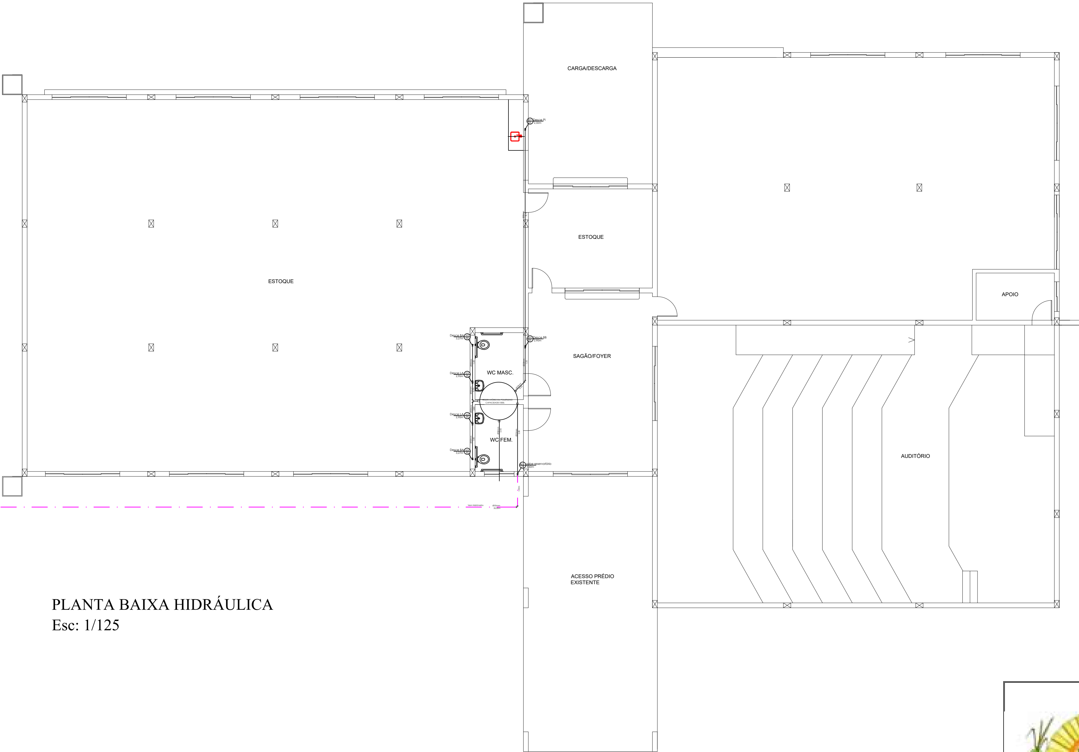
PLANTA BAIXA HIDRÁULICA Esc: 1/125