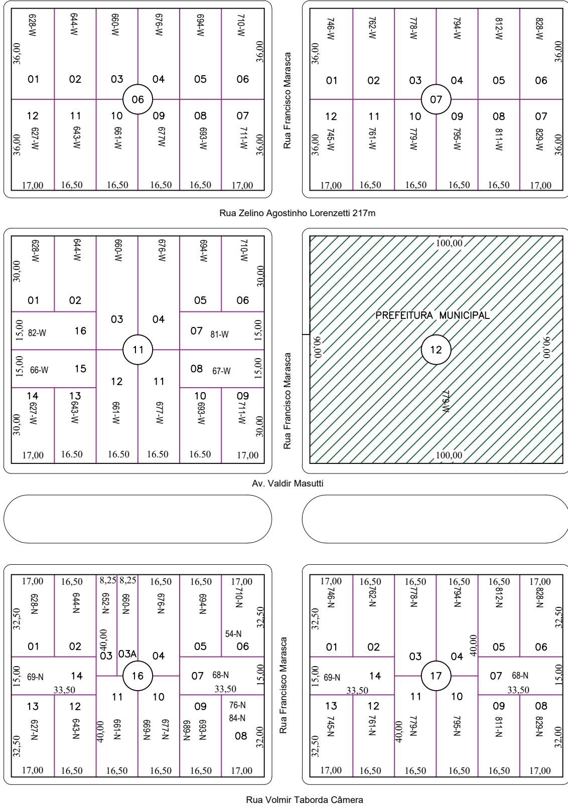
PLANTA BAIXA DE LOCALIZAÇÃO Esc: 1/1500