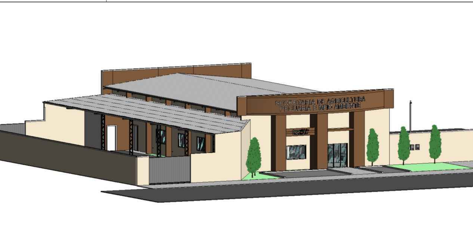
Vista Perspectiva Sem escala