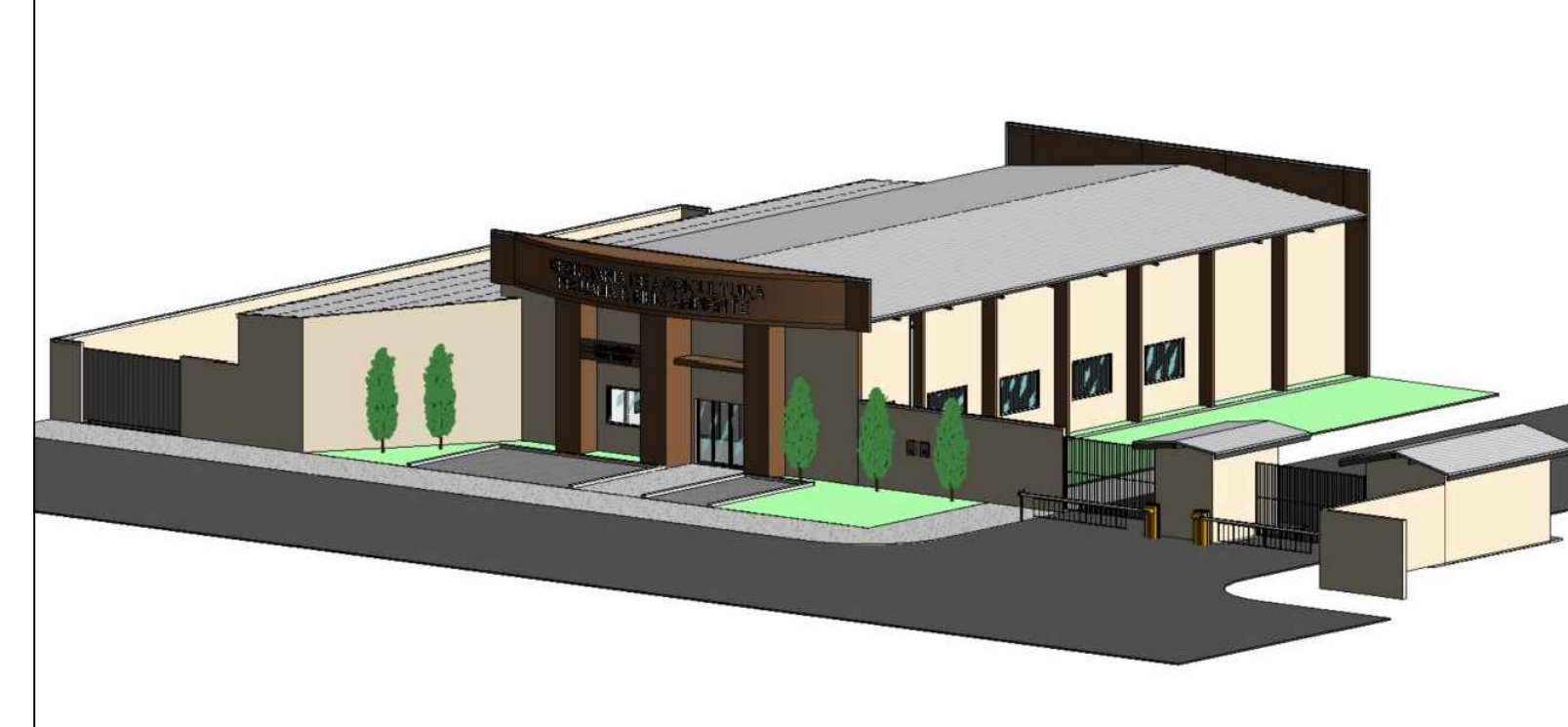
Vista Perspectiva Sem escala