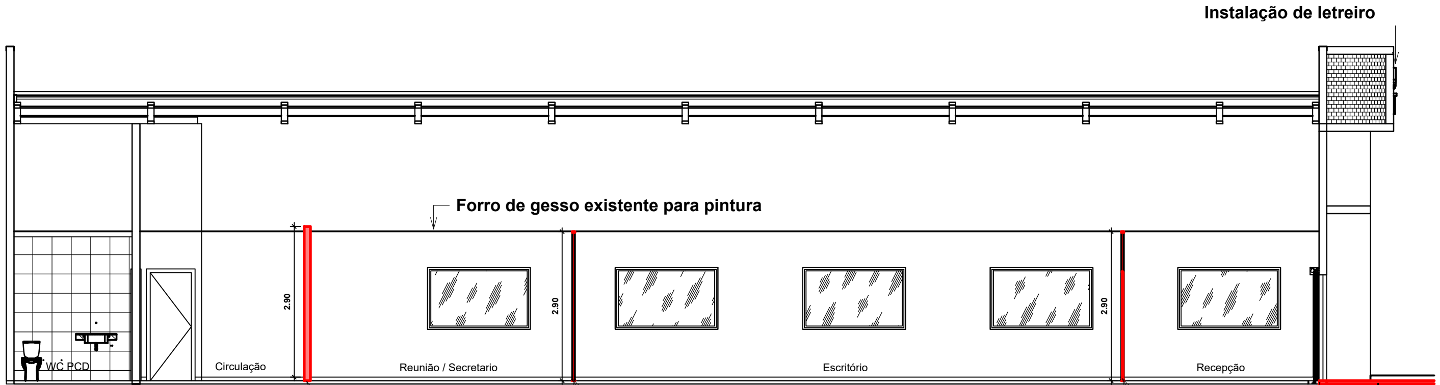
CORTE 02 Esc: 1/75