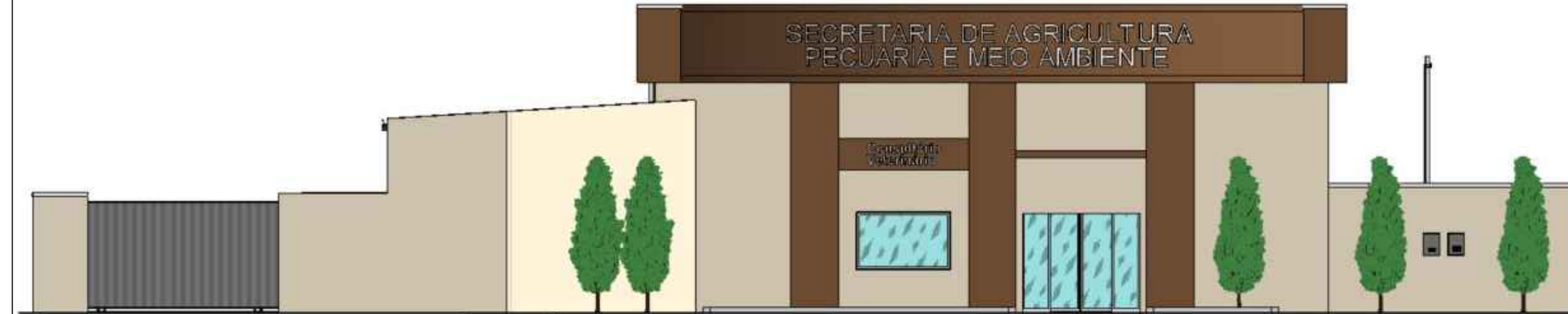
Vista Frontal Sem escala