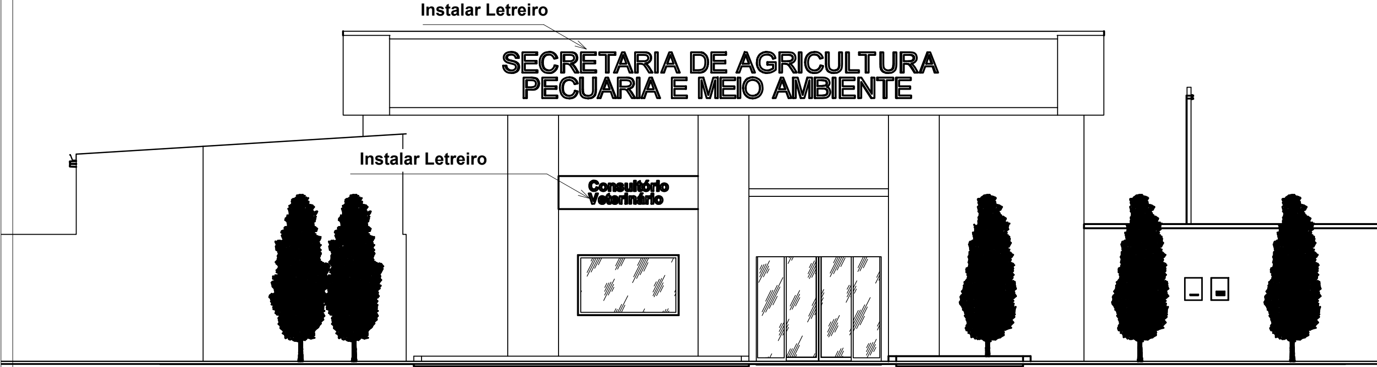
Fachada Frontal Esc: 1/75