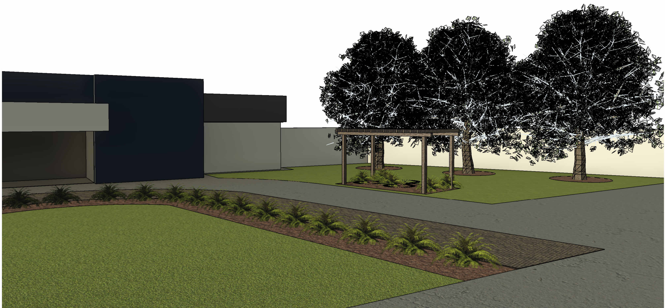
2 Vista 3D 1