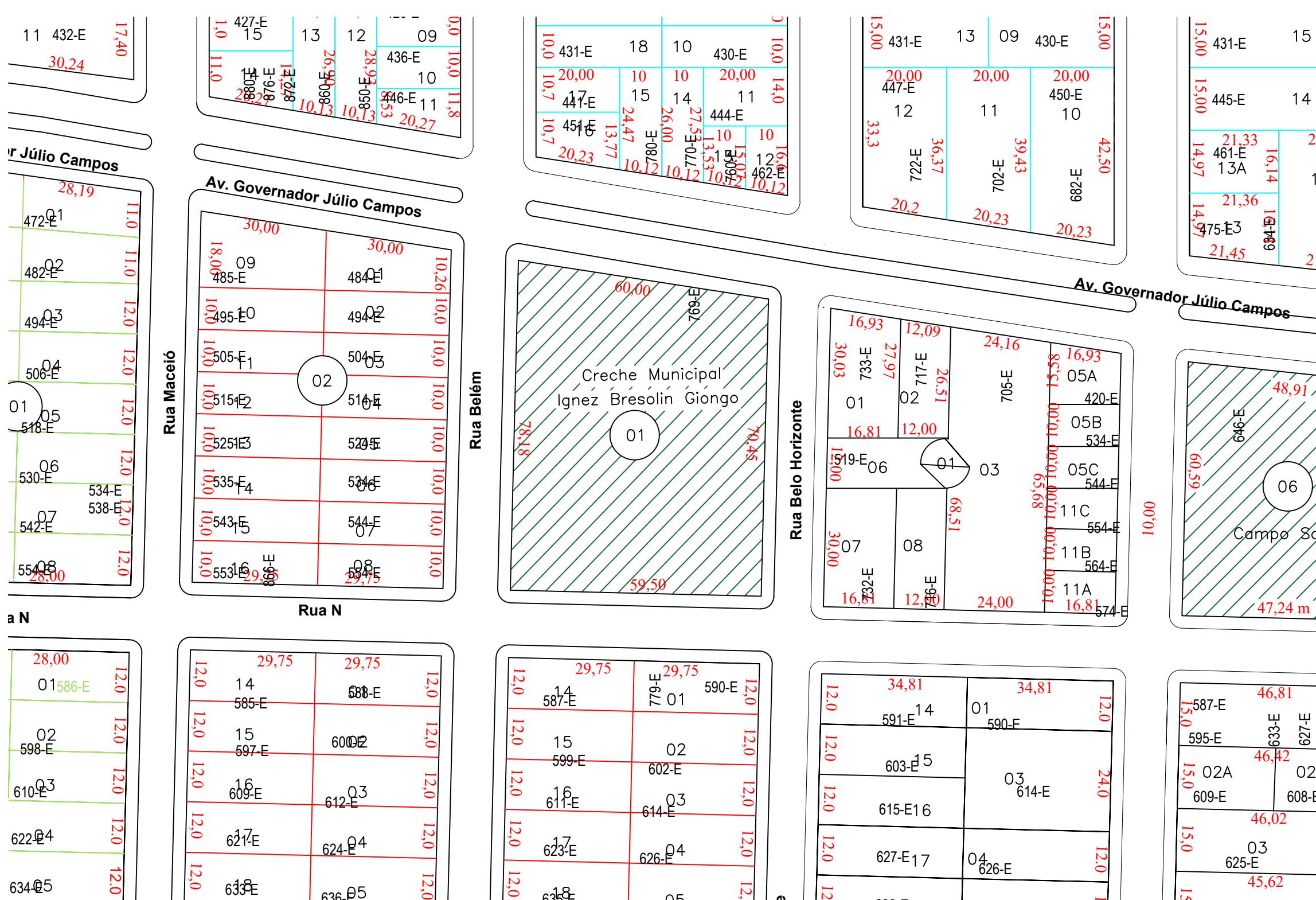
PLANTA LOCALIZAÇÃO Esc: 1/1000