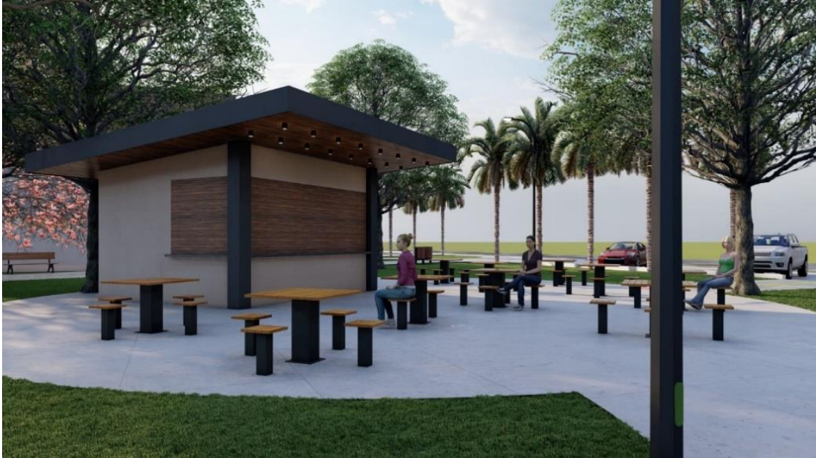
Imagem 02 - Imagem do quiosque