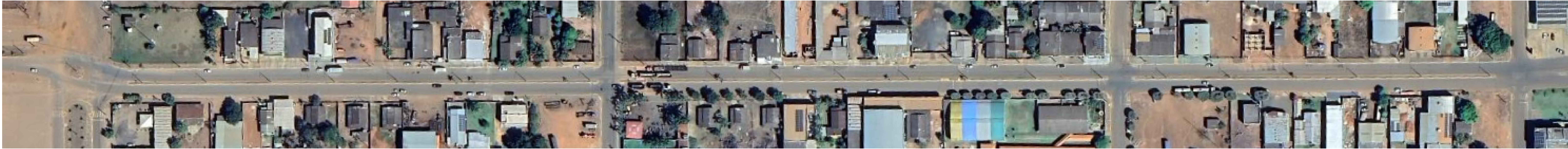
PLANTA LOCAÇÃO Google Earth